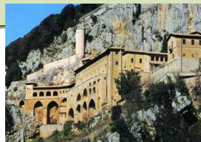
SUBIACO MONASTERO DEL SACRO SPIECO