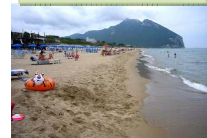
TERRACINA, IL MARE

Giovedì 17 maggio: dopo colazione, alle 10:00 ca. lasceremo l'hotel per il trasferimento all'aeroporto di Roma Fiumicino. Dopo le operazioni d'imbarco, decolleremo con il volo di linea Alitalia previsto per le ore 14:00. Alle 15:10 arrivo a Milano Linate e trasferimento in Ticino con il bus.