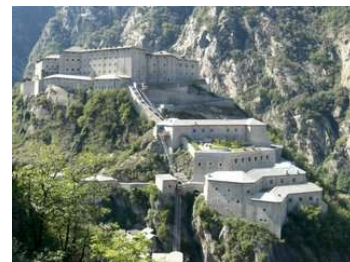
FORTE DI BARD